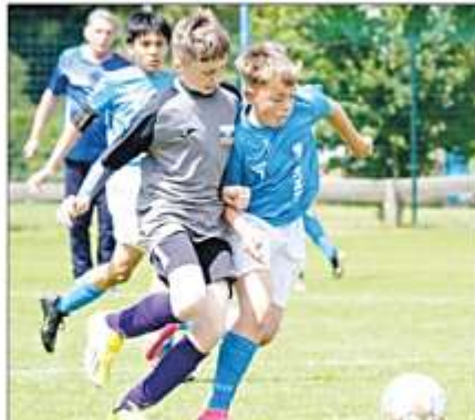
Louis behauptete den Ball im Spiel gegen die Slowakei.