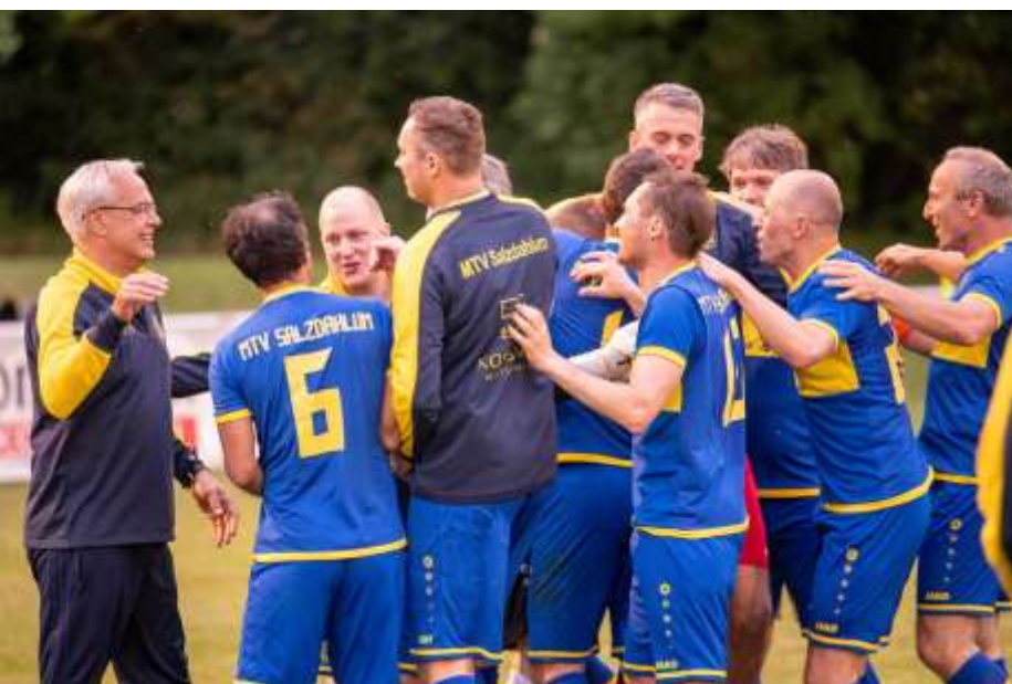
Ausgelassener Jubel, nach dem Schlusspfeif.