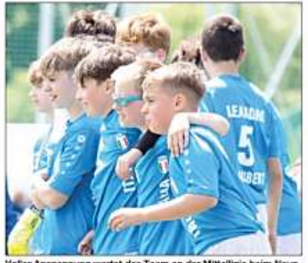
Voller Anspannung wartet das Team an der Mittellinie beim Neunmeterschießen gegen Serbien.