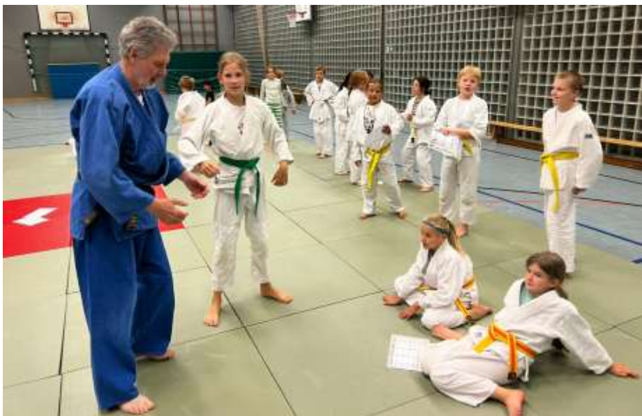
Erklärung einer Technik