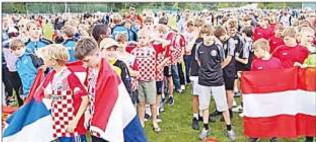
Farbenfroher Andrang bei der Siegerehrung in Jena.