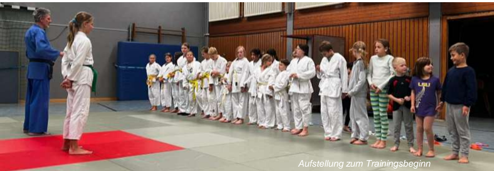
Aufstellung zum Trainingsbeginn

Auch in diesem Jahr hatten wir einen großen Zulauf auf unserer Matte. Zu den „13 alten Hasen“ kamen in diesem Jahr 20 neue Kinder hinzu. Davon sind noch 9 Kinder im Probetraining. Diese große Anzahl von Judoka stellte uns als Trainerteam vor eine große Herausforderung. Anfang des Jahres konnten wir einen interessierten Vater eines Judo Kids gewinnen, uns im Trainerteam zu unterstützen. In der Zwischenzeit ist er fester Bestandteil unseres Teams.