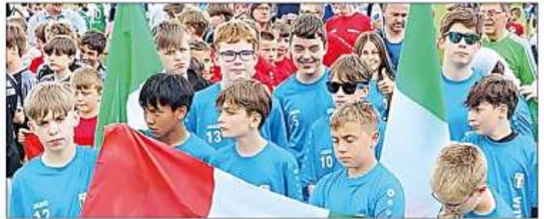
Das Team ist voller Stolz auf dem Podium angekommen. Platz 4 von 16 Teams ist ein großartiges Ergebnis - man wolle im kommenden Jahr auf jeden Fall wiederkommen.

Mini-Europameisterschaft in Jena mit nationaler und internationaler Beteiligung: