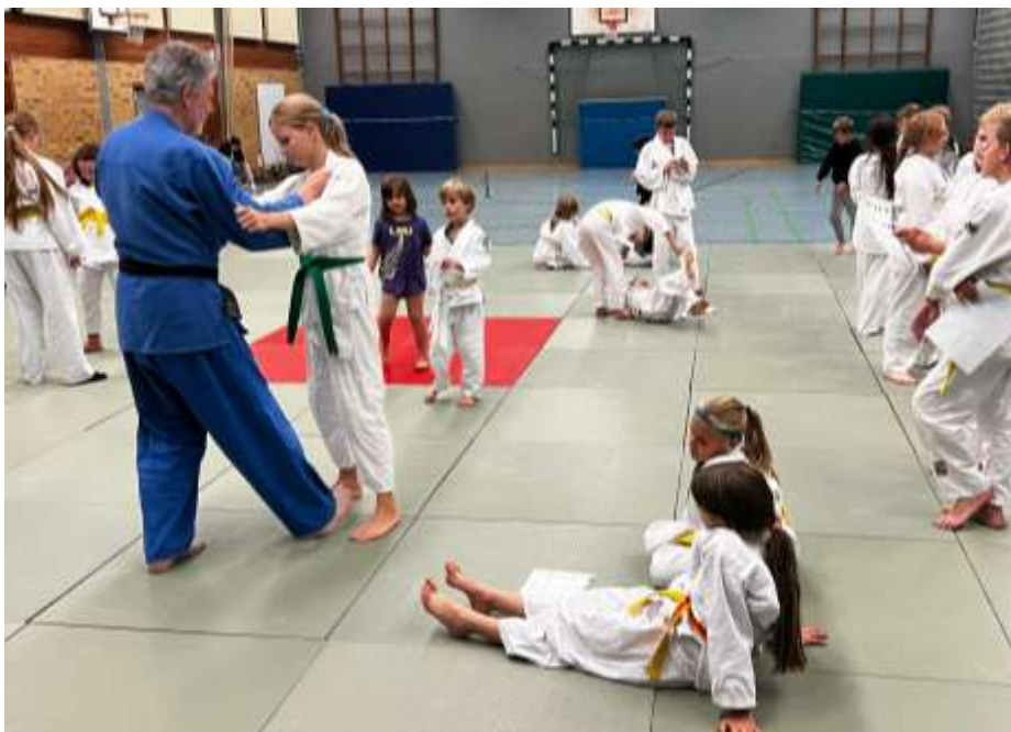
Demonstration einer Technik