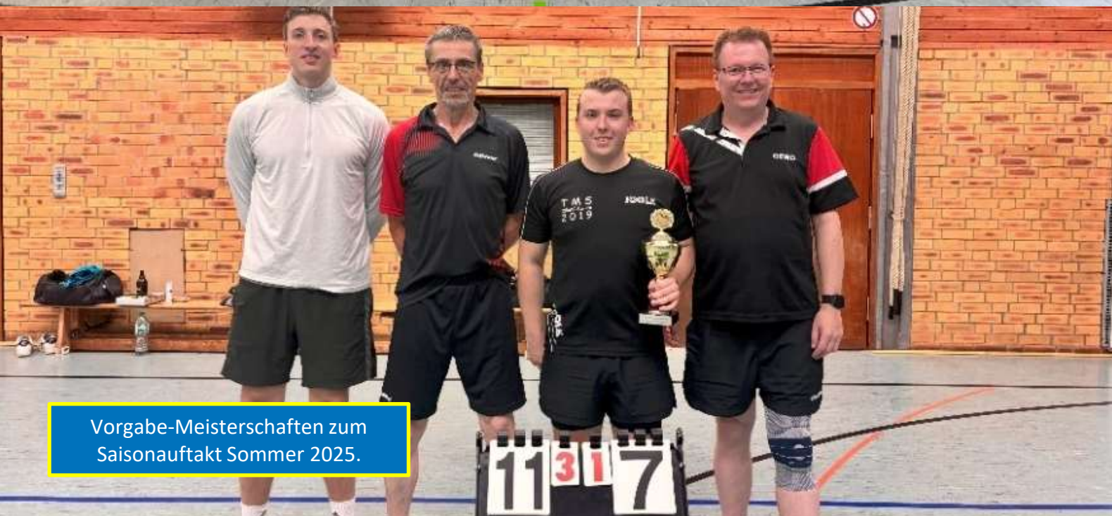
Vorgabe-Meisterschaften zum Saisonaufakt Sommer 2025.