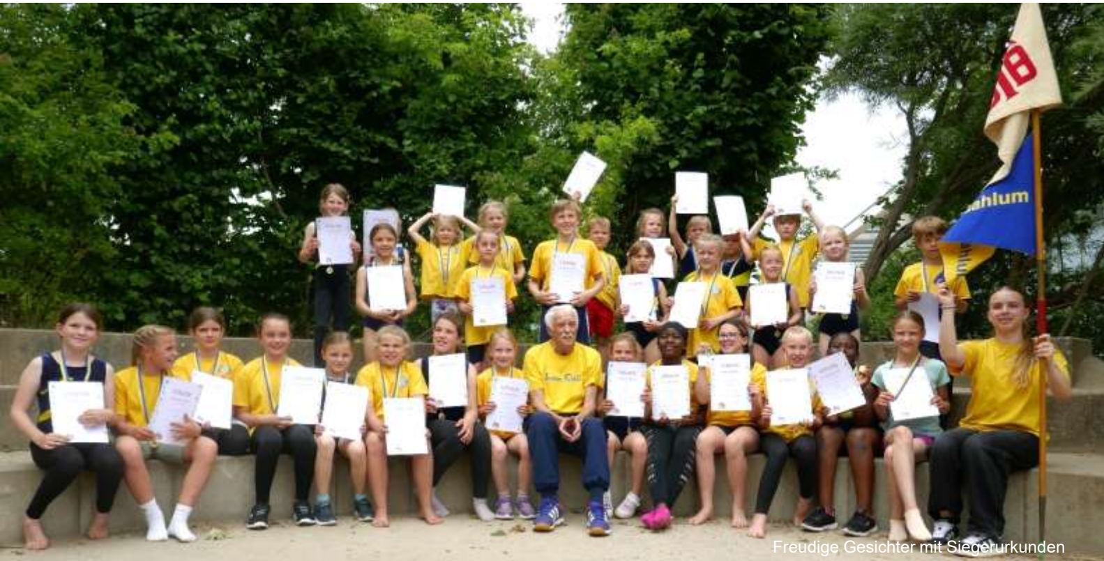
Freudige Gesichter mit Siegerurkunden

32 Turner vom MTV Salzdahlum nahmen am Kreiskinderturnfest in Lamme teil und hatten auch noch über 40 Fans mitgebracht. 174 Kinder aus den Vereinen MTV Salzdahlum, SKG Dibbesdorf (15 Teilnehmer), SV Lindenberg (13), TSV Lamme (48), TSV Völkenrode (9), SV Waggum (21), SV RW Volkmarode (9), MTV Braunschweig (21) nahmen daran teil. Alle Kinder der Jahrgänge 2012 – 2020 starteten im Teileturnen: Jeder Teilnehmer musste an vier verschiedenen Geräten jeweils drei Übungen zeigen. Zur Auswahl standen die Geräte Sprung (Kasten längs/quer, Bock Minitramp), Reck, Barren/Ringe, Boden sowie der Schwebebalken/Bank. Die Übungen waren so gestellt, dass sie von allen Kindern geleistet werden konnten. Zweimal konnten wir an einem Wochenende Sonderturnen anbieten. Dank der Elternhilfe beim Auf-/Abbau und als Übungshelfer konnten alle Kindern die Übungen noch besser verinnerlichen bzw. auch noch verbessern. Danke! In der einen Stunde am Mittwoch ist das schwer umsetzbar. Und auch die Platzierungen konnten sich sehen lassen. Alle Kinder landeten in der ersten Hälfte der jeweiligen Altersklasse und sieben Mal standen wir auch noch auf dem Treppchen, zur Belohnung erhielten alle eine Medaille und eine Urkunde. Zwei Geräte aus unserer Halle mussten auch noch nach Lamme transportiert werden, eine Punktrichterin (Finja Schomburg) konnten wir auch stellen und die Gruppenbetreuung der Eltern war wie immer „super“!