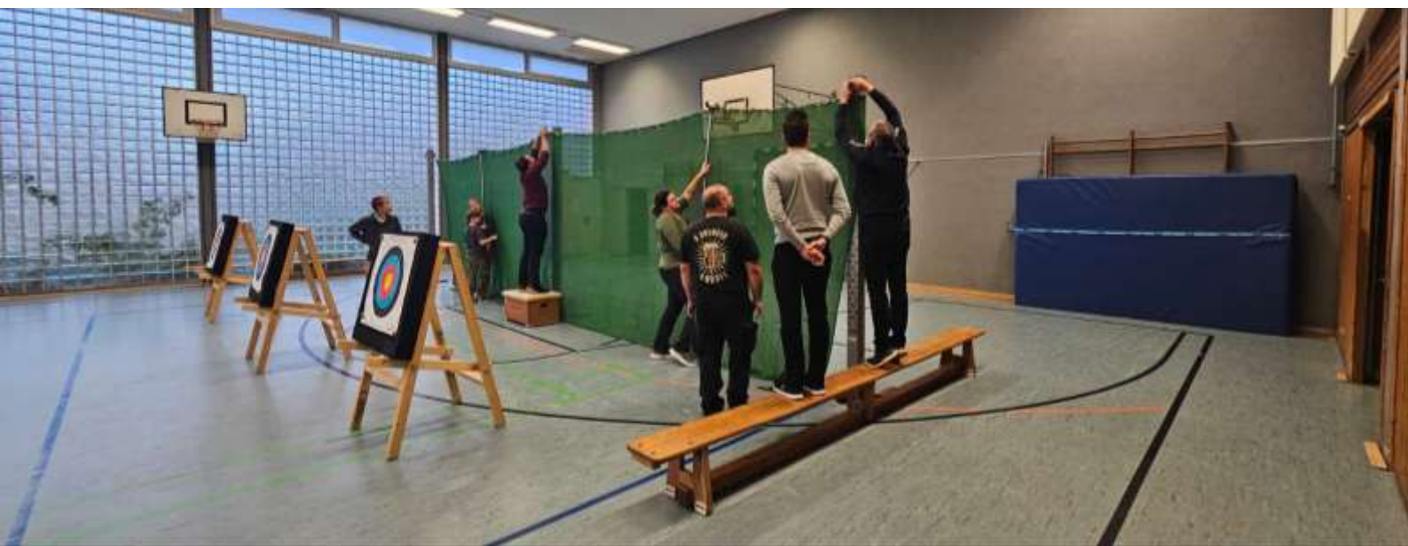
Aufbau des Pfeilfangnetzes Indoor und Outdoor